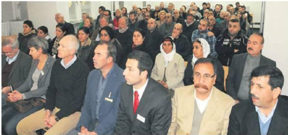
Großes Interesse: Unter dem Titel „Unsere Nachbarn die Eziden: Wer sind sie?“ hatten das Integrationsbüro und der ezidische Kulturverein in den Medienraum der Dewezet eingeladen.

Etwa 2000 Jahre vor Christus begann die Geschichte des Ezidentums. Jünger demnach als Judentum und Hinduismus, älter als der Buddhismus. Eziden